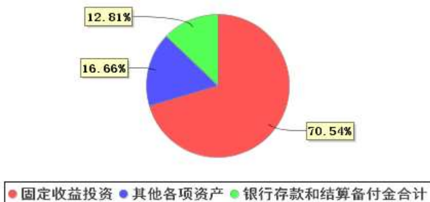
投资组合资产配置图表(2021年3月31日)