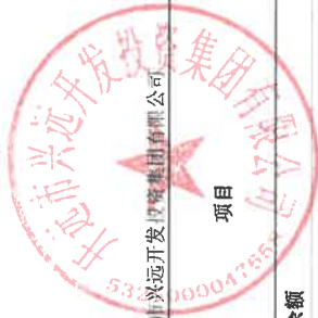
母公司所有者权益变动表 2020年1-12月