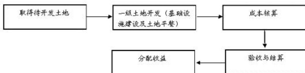
图 发行人一级土地开发流程图

发和富山产业新城土地一级开发。一级土地开发业务采用政府授权形式，授权发行人下属子公司进行土地一级开发，开发用地在招拍挂前属于政府，不注入发行人，开发资金由发行人筹措，土地开发完毕，由政府与发行人进行成本核算和验收结算，政府出让土地后，发行人可按照土地出让收入的一定比例获取收益，发行人用于一级开发的土地不计入发行人财务报表，发行人进行土地一级开发发生的支出计入存货当中的开发成本，借记存货-开发成本，贷记银行存款；一级土地开发完毕，当地政府进行招拍挂出让土地后，发行人根据土地出让分成确认收入，借记应收账款，贷记主营业务收入，同时结转出让土地的成本，借记主营业务成本，贷记存货-开发成本。发行人一级土地开发流程如下图所示：