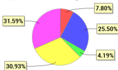
投资组合资产配置图表(2021年3月31日)