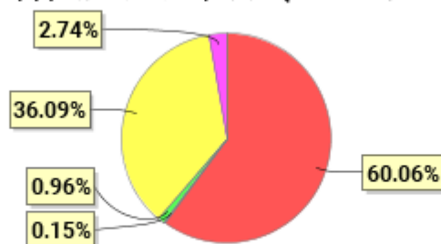
投资组合资产配置图表(2021年3月31日)

● 固定收益投资 ● 买入返售金融资产 ● 其他各项资产 ● 权益投资 ● 银行存款和结算备付金合计