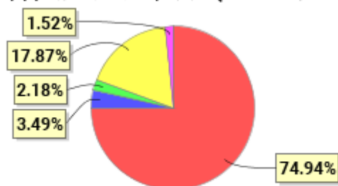
投资组合资产配置图表(2021年3月31日)