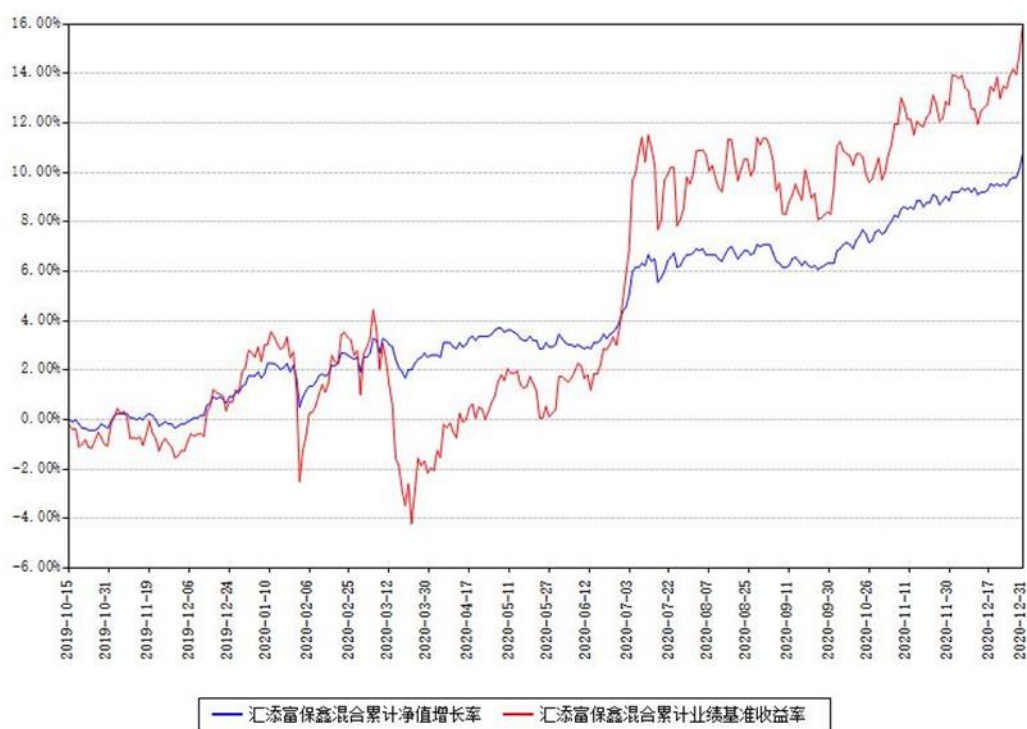
汇添富保鑫混合累计净值增长率与同期业绩基准收益率对比图

(二) 自基金合同生效以来基金累计净值增长率变动及其与同期业绩比较基准收益率变动的比较图