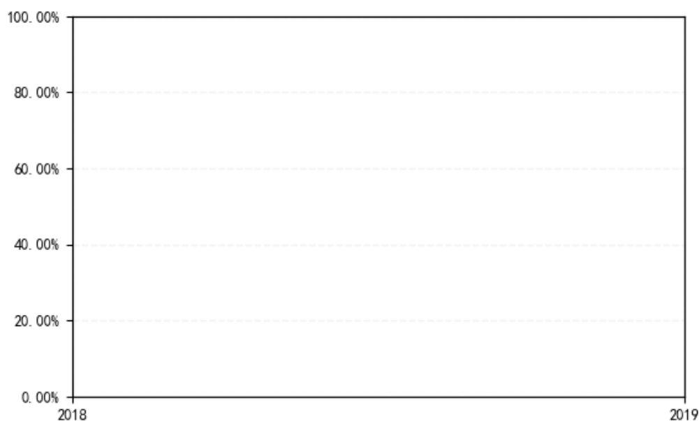
南方卓利C每年净值增长率与同期业绩比较基准收益率的对比图（2019年12月31日）