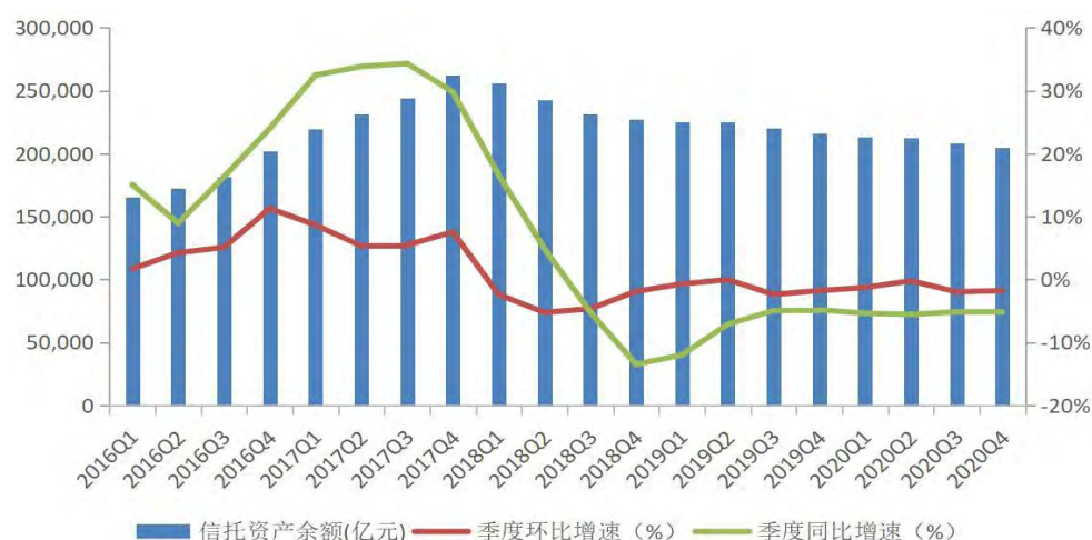
图表 3-15：2016 年以来信托资产余额及变动增速情况

从资金来源看，截至 2020 年 4 季度末，集合信托规模为 10.17 万亿元，占比 49.65%，同比上升 3.72 个百分点，比 3 季度末（49.42%）上升 0.23 个百分点。单一信托规模为 6.13 万亿元，占比 29.94%，同比下降 7.16 个百分点，比 3 季度末（33.18%）下降 3.24 个百分点。管理财产信托为 4.18 万亿元，占比 20.41%，同比上升 3.44 个百分点，比 3 季度末（17.41%）上升 3 个百分点。从资产功能划分来看，事务管理类信托为 9.19 万亿元，同比 2019 年 4 季度末 10.65 万亿元减少 1.46 万亿元，较 2017 年末历史高点 15.65 万亿元减少 6.46 万亿元；业务占比为 44.84%，同比 2019 年 4 季度末 49.30%下降 4.46 个百分点。压降的事务管理类中的绝大多数是以监管套利、隐匿风险为特征的金融同业通道业务。按照监管部门要求，事务管理类业务量与占比一直不断下降，金融机构之间多层嵌套、资金空转现象明显减少。