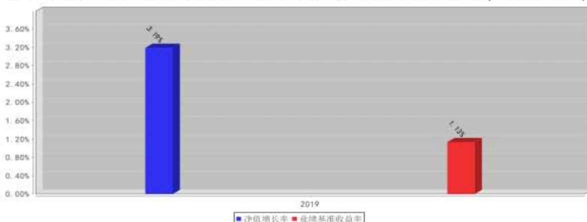
西部利得聚享一年定开债券C基金每年净值增长率与同期业绩比较基准收益率的对比图(2019年12月31日)