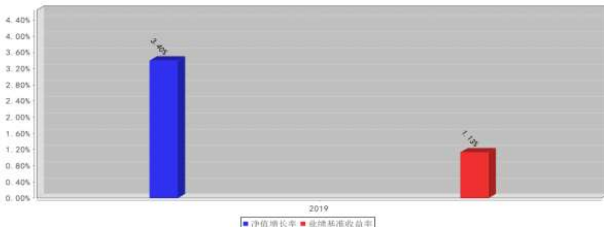
西部利得聚享一年定开债券A基金每年净值增长率与同期业绩比较基准收益率的对比图(2019年12月31日)