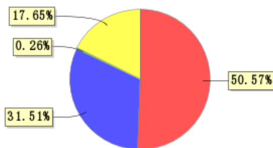
投资组合资产配置图表(2021年3月31日)

● 固定收益投资 ● 买入返售金融资产 ● 其他各项资产 ● 银行存款和结算备付金合计