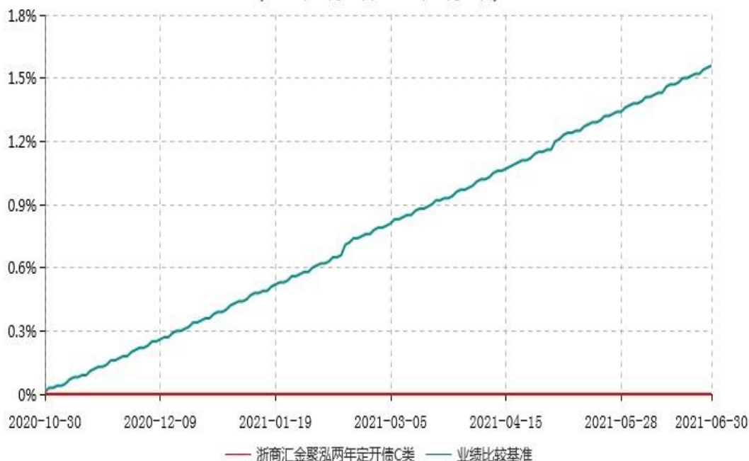
浙商汇金聚泓两年定开债C类累计净值增长率与业绩比较基准收益率历史走势对比图 (2020年10月30日-2021年06月30日)

注：本基金合同生效日为 2020 年 10 月 30 日，至本报告期末，本基金已完成建仓，但报告期末距建仓结束不满一年，建仓期为 2020 年 10 月 30 日-2021 年 4 月 29 日，本基金建仓期结束时各项资产配置比例符合合同的约定。