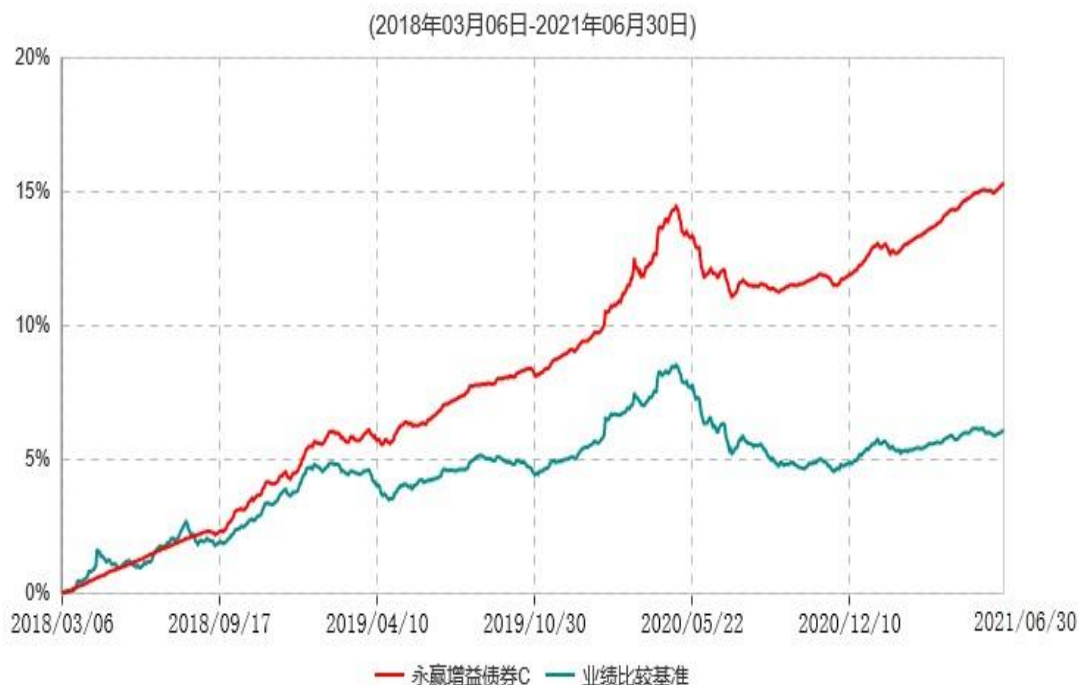
永赢增益债券C累计净值增长率与业绩比较基准收益率历史走势对比图

注：本基金建仓期为本基金合同生效日起 6 个月，建仓期结束当日，除债券投资比例未达到合同约定外，其他各项资产配置符合合同约定。债券投资比例未达到合同约定系交易对手原因导致现券买入交易结算失败所致，本基金于 2018 年 9 月 6 日及时买入债券将债券投资比例提高至合同约定的范围内。