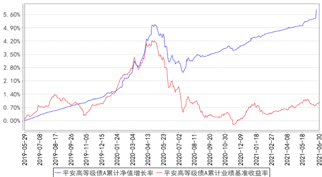
平安高等级债 A 累计净值增长率与同期业绩比较基准收益率的历史走势对比图