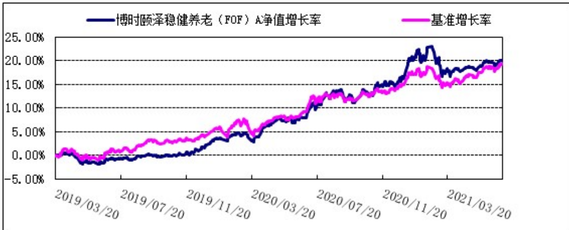
2. 博时颐泽稳健养老（FOF）C: