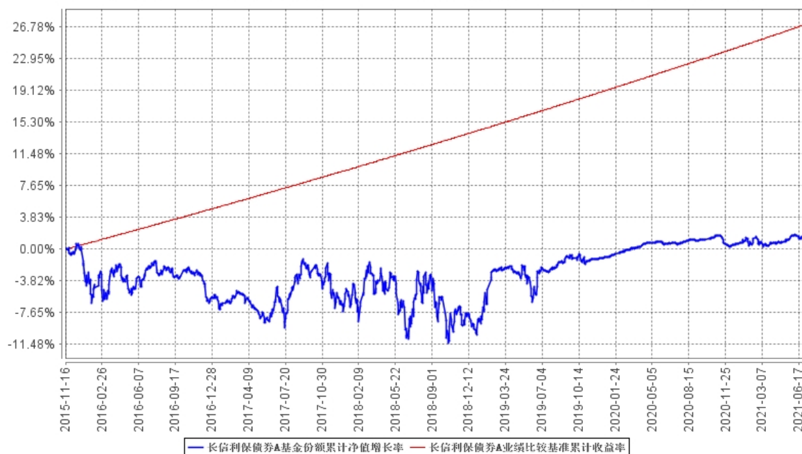
长信利保债券A基金份额累计净值增长率与同期业绩比较基准收益率的历史走势对比图