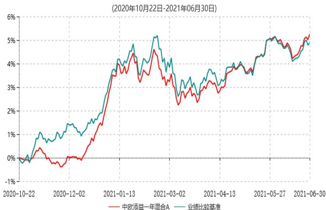
中欧添益一年混合A累计净值增长率与业绩比较基准收益率历史走势对比图

注：本基金基金合同生效日期为 2020 年 10 月 22 日，自基金合同生效日起到本报告期末不满一年，按基金合同的规定，本基金自基金合同生效起六个月为建仓期，建仓期结束时各项资产配置比例已经符合基金合同约定。