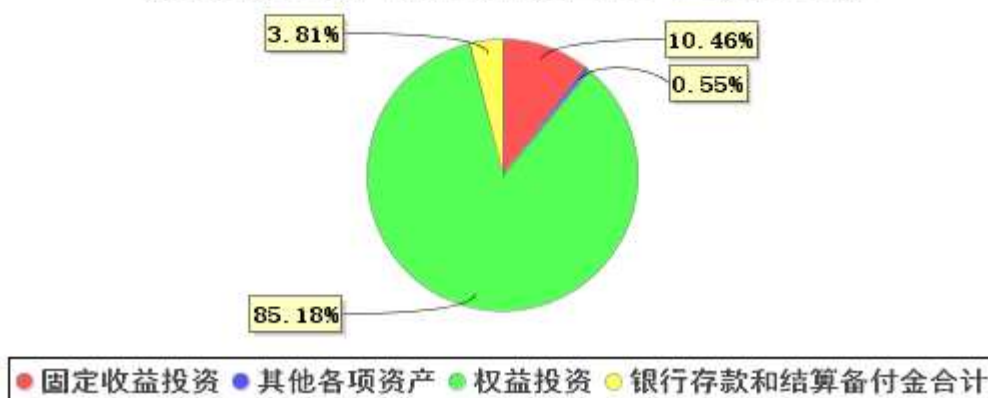
投资组合资产配置图表(2020年6月30日)