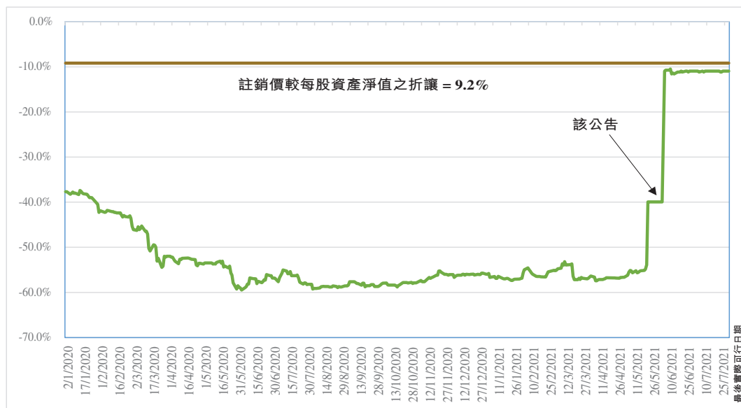
圖二：股份價格較每股資產淨值之折讓變動

註銷價每股計劃股份港幣20.80元較每股資產淨值約港幣22.90元折讓9.2%。吾等已不時審閱股份價格較每股資產淨值之折讓(基於中期及全年業績公告以及月報表)，現載於下圖：