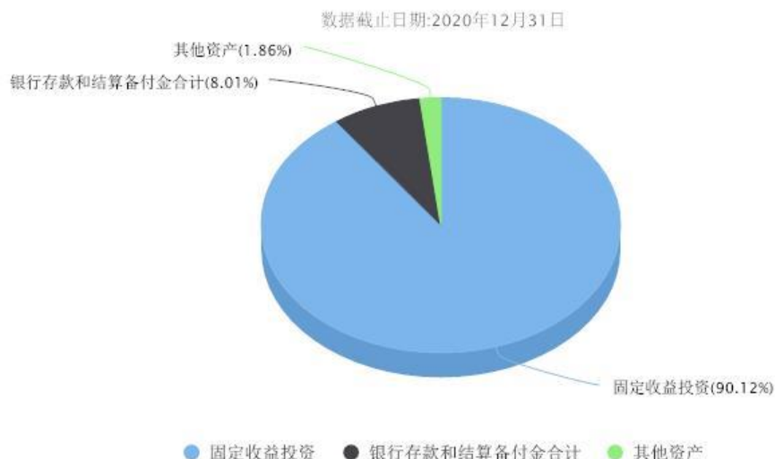
汇添富美元债债券(QDII)人民币A投资组合资产配置图表