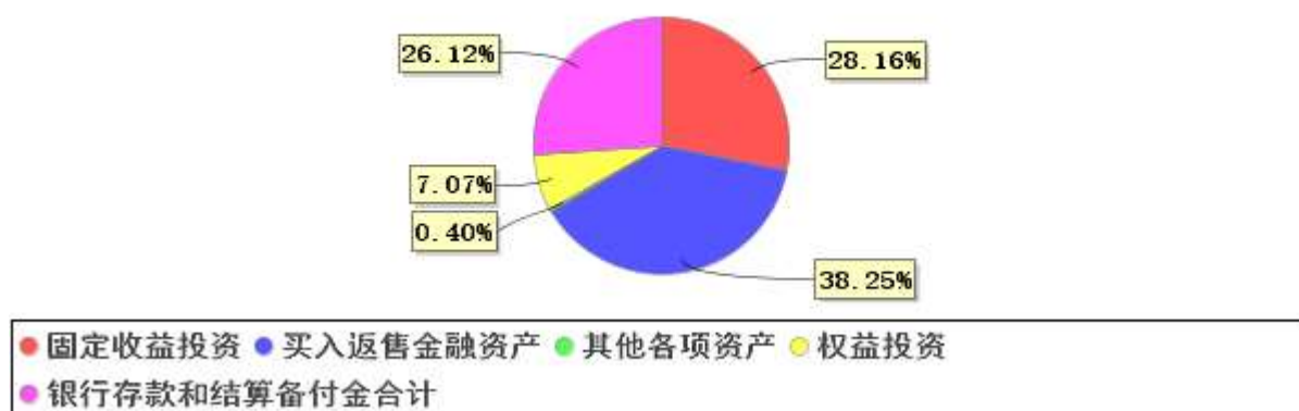
投资组合资产配置图表(2020年6月30日)