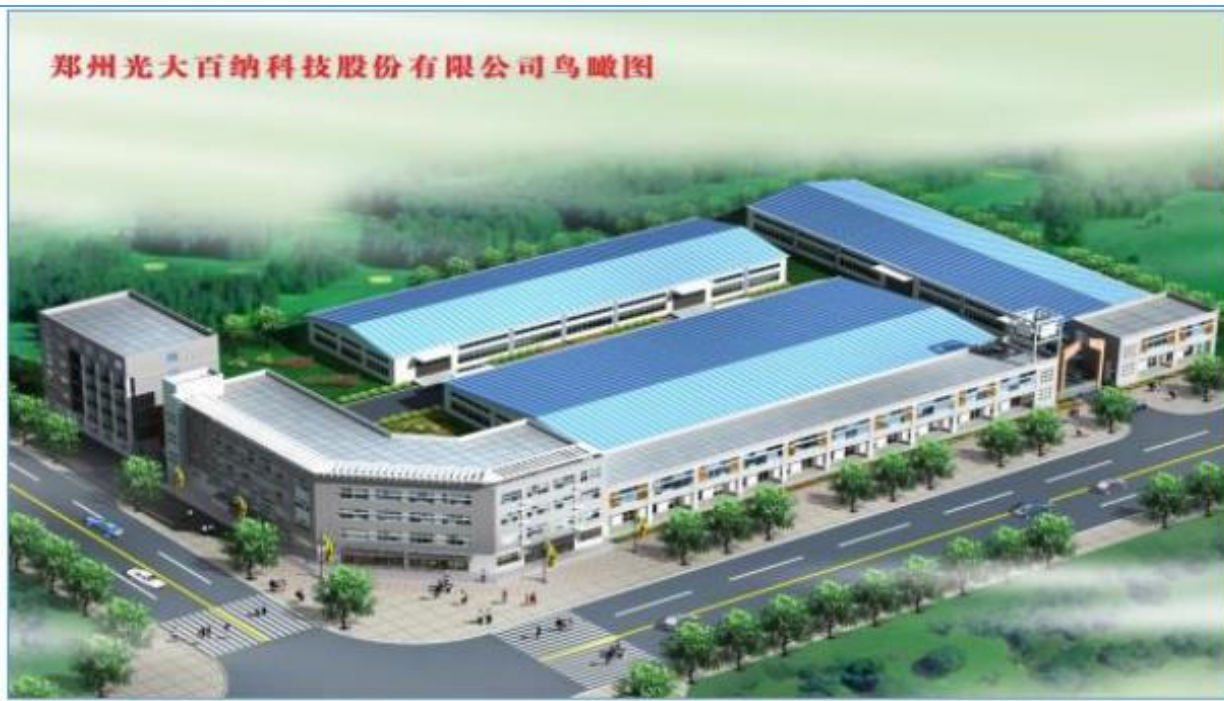
郑州光大百纳科技股份有限公司鸟瞰图

Zhengzhou Guangda Baina Technology Co.,Ltd.