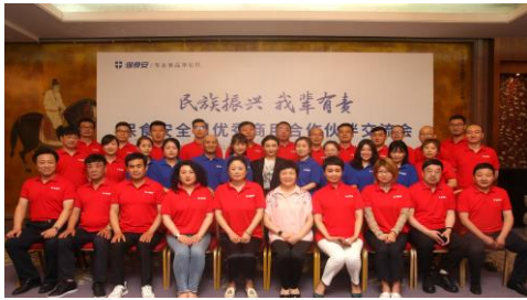
5月26日“民族振兴 我辈有责” 全国优秀商用合作伙伴交流会成功举办