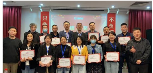
4月21日“赢在专业” 保食安营销特训营成功举办