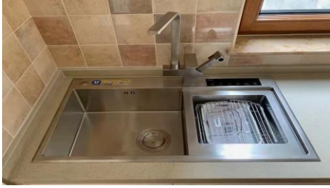
5月18日 保食安专业食品净化水槽机 青岛即墨精装楼盘项目顺利交付