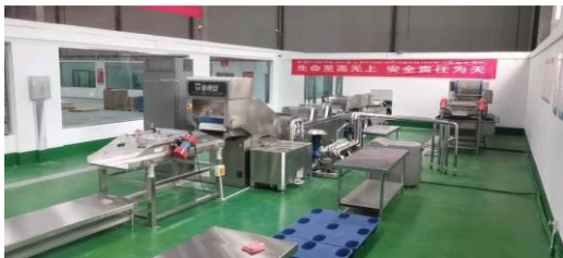
专业食品净化工业机 西藏生鲜项目顺利运行