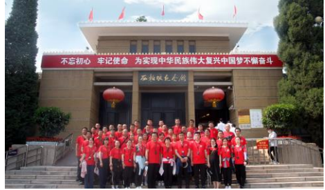
5月21日“民族振兴 我辈有责” 公司管理团队价值观提升团建活动