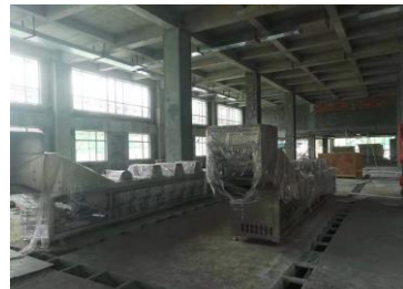
专业食品净化工业机项目 在西藏成功落地