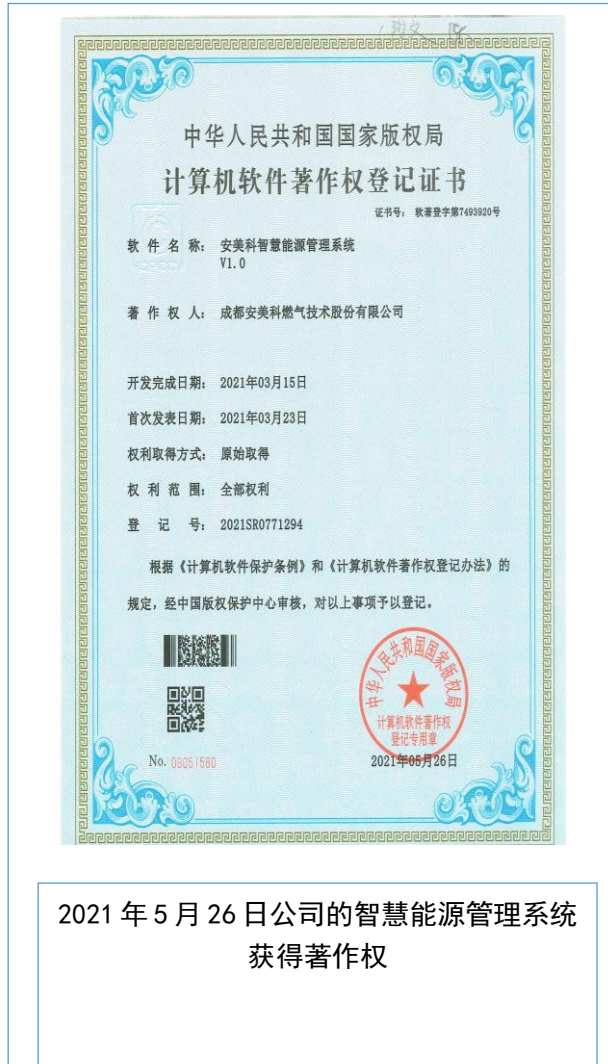
2021年5月26日公司的智慧能源管理系统获得著作权