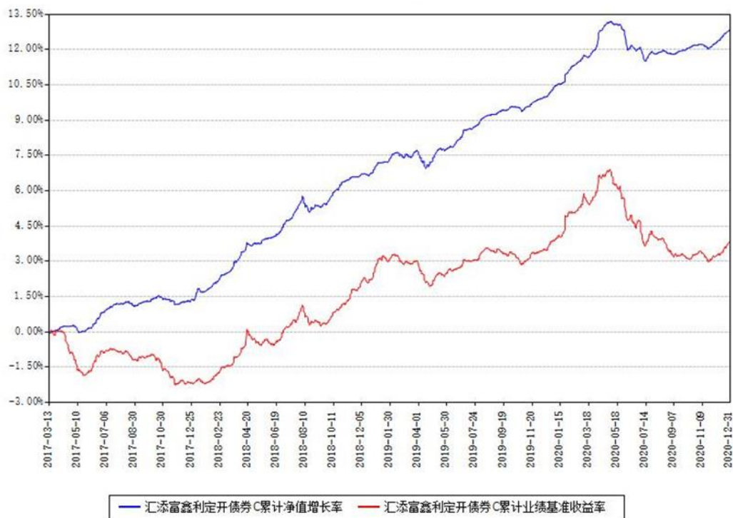
汇添富鑫利定开债券C累计净值增长率与同期业绩基准收益率对比图