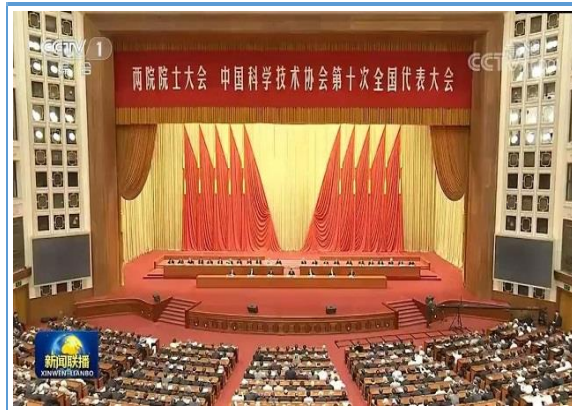
刘学新董事长参加中国科协第十次全国代表大会