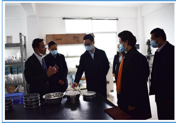
湖北省副省长宁咏一行莅临斯曼股份调研工作