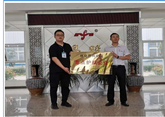
斯曼股份荣获红安县重点护航企业