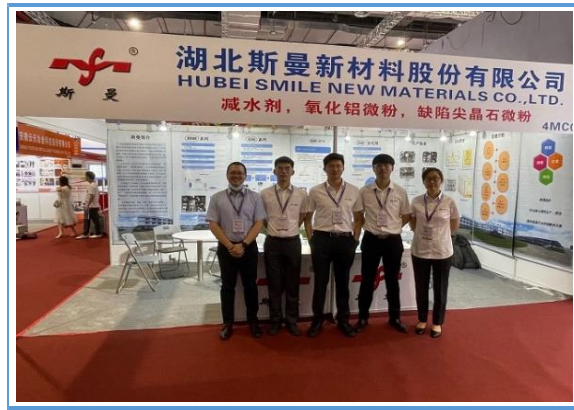
斯曼股份参加 2021 年第二十届中国（上海）国际冶金工业展览会