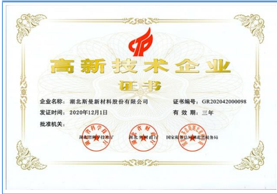
斯曼股份被认定为湖北省 2020 年第一批高新技术企业