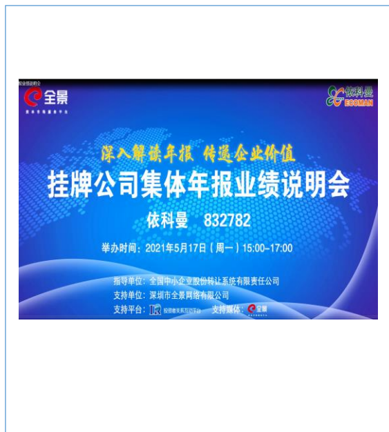
公司 2021 年 5 月 17 日线上召开了“2020 年年报业绩说明会”