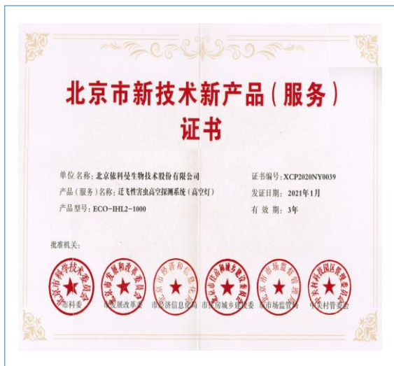
公司的“迁飞性害虫高空探测系统(高空灯)”荣获“北京市新技术新产品(服务)证书”