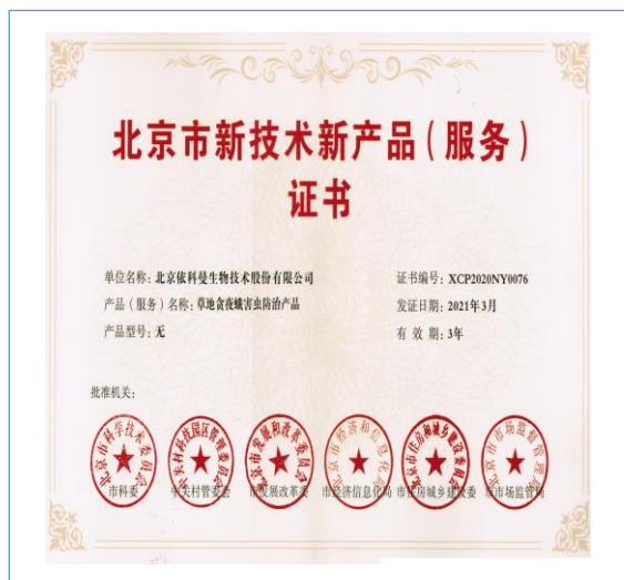
公司的“草地贪夜蛾害虫防治产品”荣获“北京市新技术新产品(服务)证书”