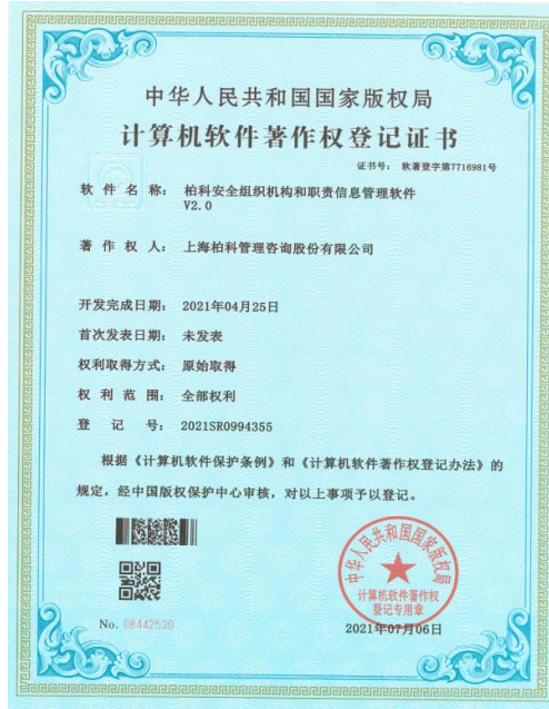
软件著作权证书：柏科安全组织机构和职责信息管理软件