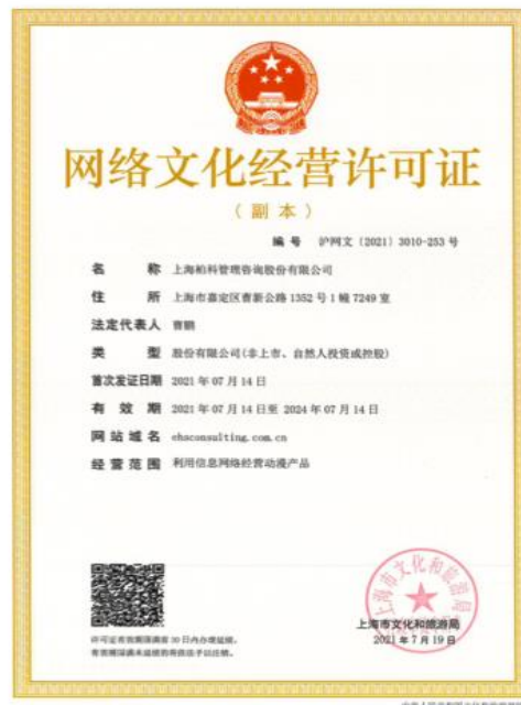
许可证：2021年7月公司取得网络文化经营许可证