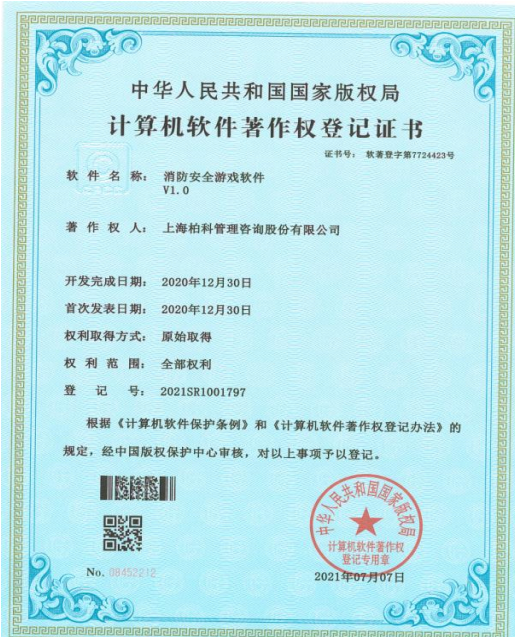
软件著作权证书：消防安全游戏软件著作权