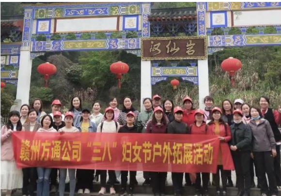
3. “三八”妇女节户外拓展活动