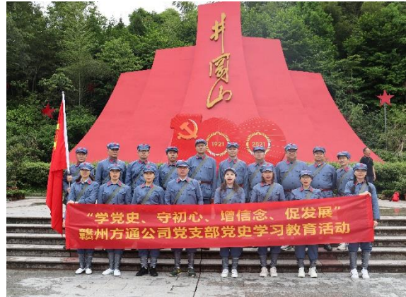
2. 党支部党史学习教育活动