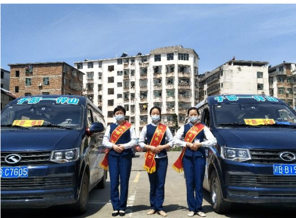
5. 开通公交定制班线服务