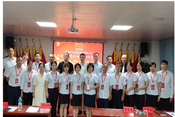
4. 开展“党史+安全”知识竞赛