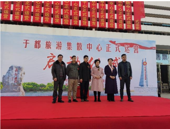
1. 旅游集散中心揭牌运营