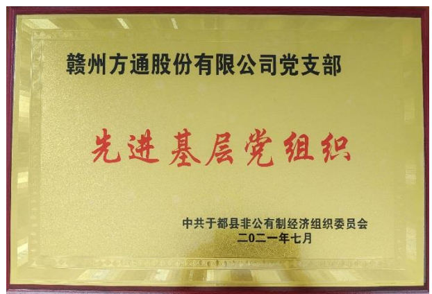
6. 荣获“先进基层党组织”称号