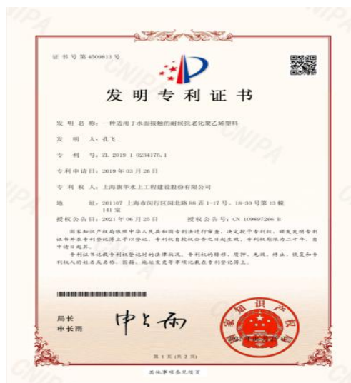
6月公司又荣获一项发明专利，上海旗华共获得122项专利。