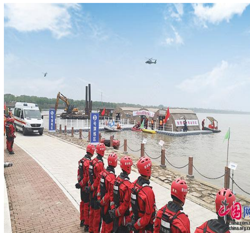
旗华承建的“便捷式水上移动医院”首次亮相长三角水域应急救援实战拉动演练