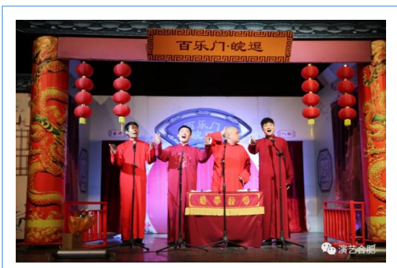
合肥百乐门剧场皖逗封箱演出