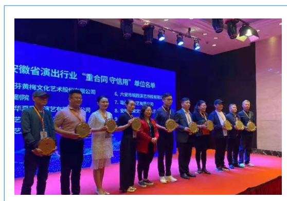
公司荣获“重合同 守信用”单位授牌