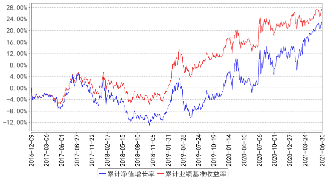
融通可转债债券A累计净值增长率与同期业绩比较基准收益率的历史走势对比图