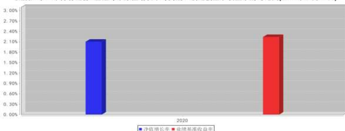
大成汇享一年持有混合A基金每年净值增长率与同期业绩比较基准收益率的对比图(2020年12月31日)

注:1、基金的过往业绩不代表未来表现。 2、如合同生效当年不满完整自然年度的,按实际期限计算净值增长率。