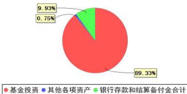
投资组合资产配置图表(2021年6月30日)