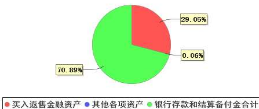
投资组合资产配置图表(2021年6月30日)