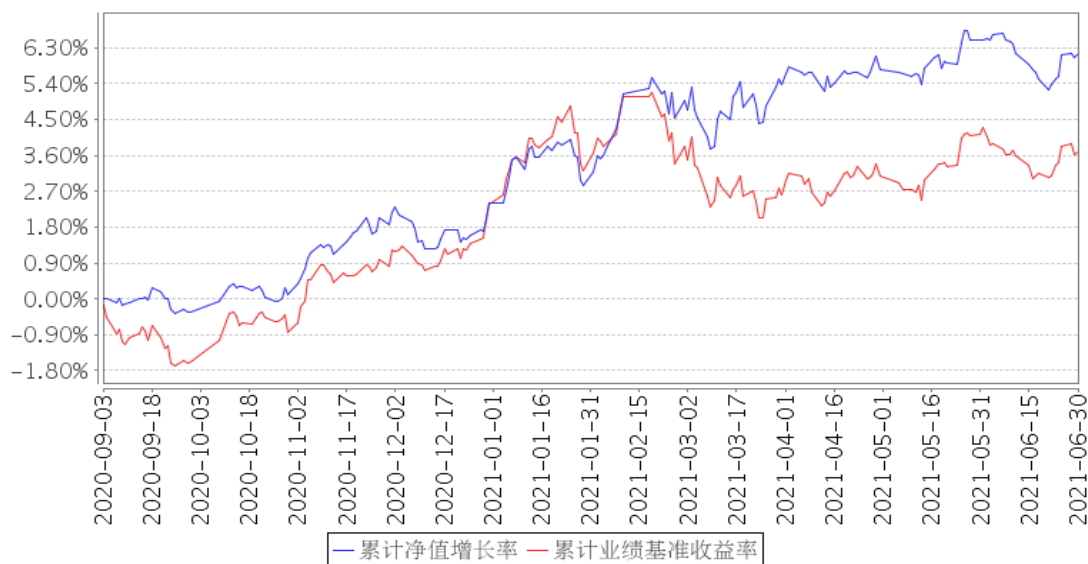
安信平稳双利3个月持有混合A累计净值增长率与同期业绩比较基准收益率的历史走势对比图