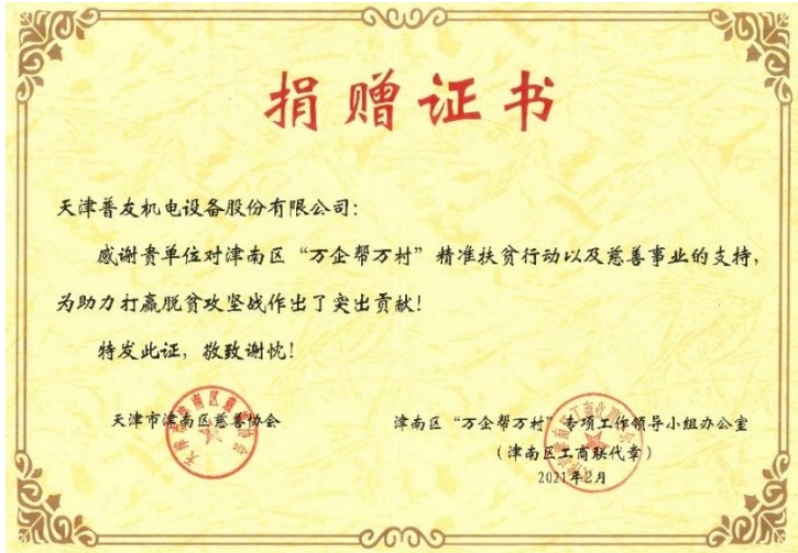
2021 年 2 月公司获得“万企帮万村”精准扶贫捐赠证书。