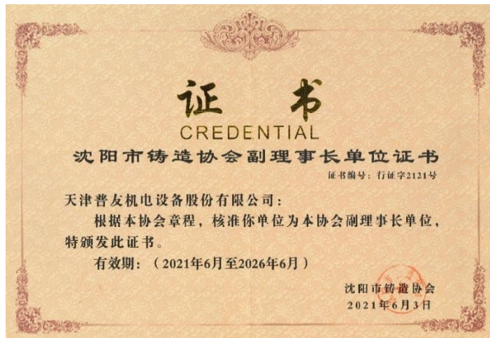
2021 年 6 月公司获得沈阳市铸造协会的批准，成为沈阳铸造协会副理事长单位。