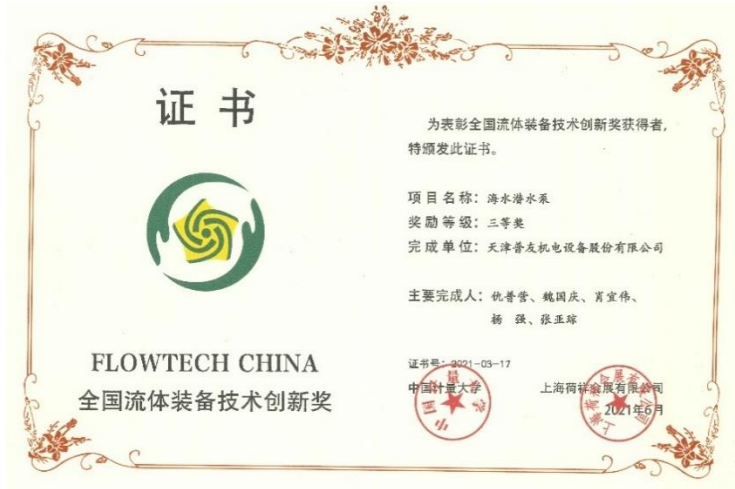
2021 年 6 月公司“海水潜水泵”获得全国流体装备技术创新奖。