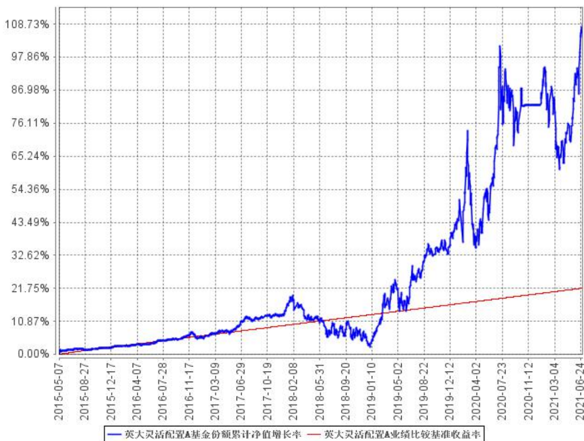
英大灵活配置A基金份额累计净值增长率与同期业绩比较基准收益率的历史走势对比图