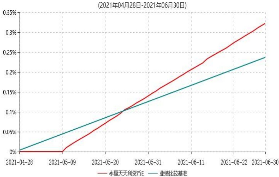
永赢天天利货币E累计净值收益率与业绩比较基准收益率历史走势对比图

注：本基金自 2021 年 4 月 28 日增设 E 类基金份额，截至本报告期末，本类基金份额生效未满 1 年。