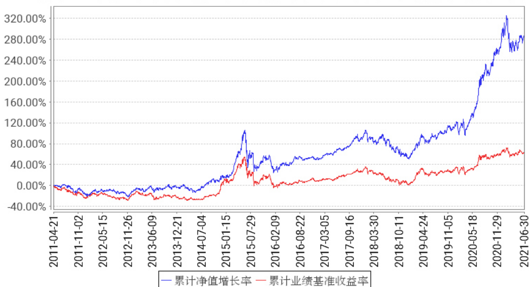
工银消费服务混合A累计净值增长率与同期业绩比较基准收益率的历史走势对比图