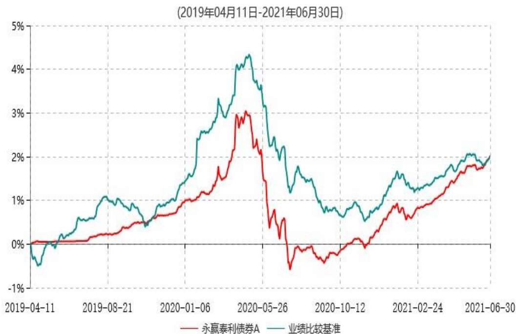
永赢泰利债券A累计净值增长率与业绩比较基准收益率历史走势对比图