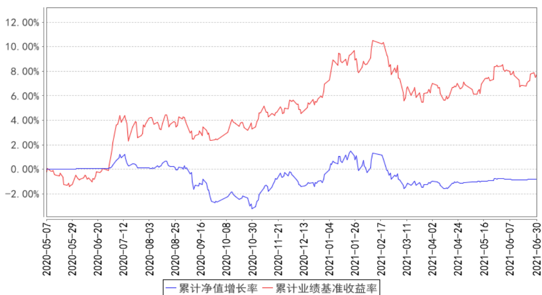
西部利得新享混合A累计净值增长率与同期业绩比较基准收益率的历史走势对比图