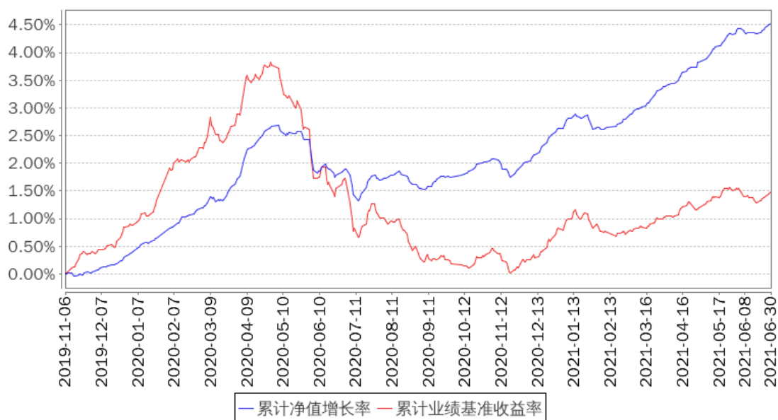
招商添韵3个月定开债A累计净值增长率与同期业绩比较基准收益率的历史走势对比图