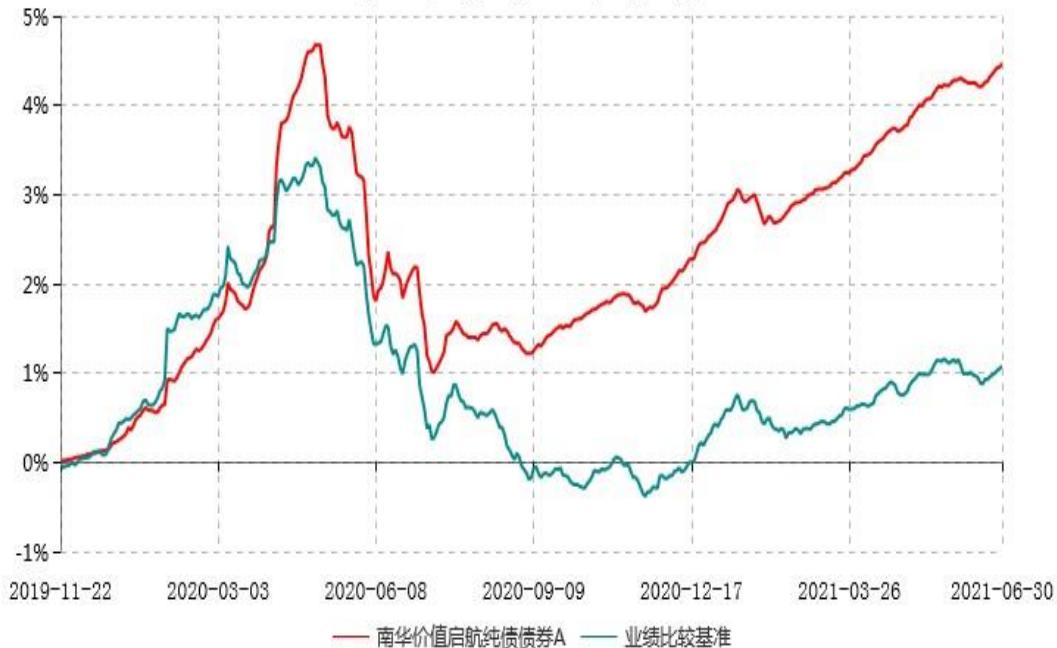
南华价值启航纯债债券A累计净值增长率与业绩比较基准收益率历史走势对比图 (2019年11月22日-2021年06月30日)