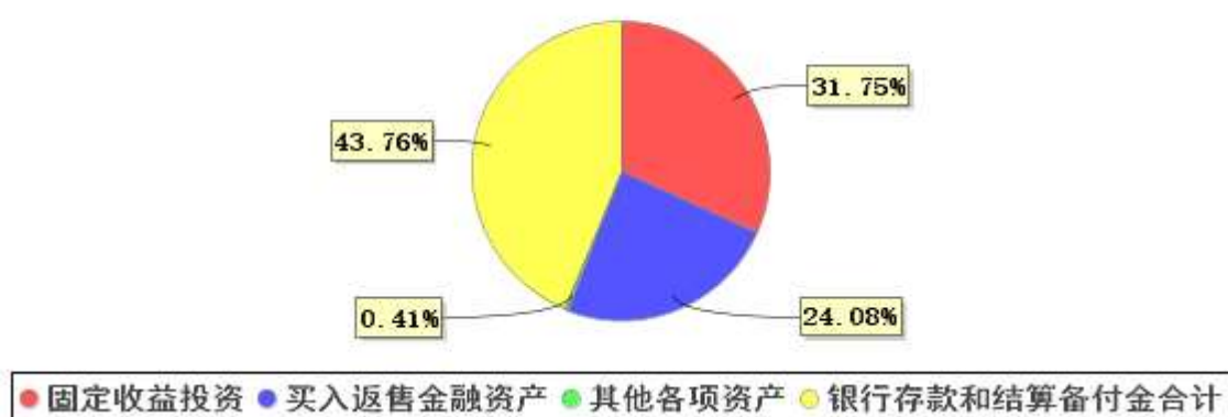
投资组合资产配置图表(2021年6月30日)