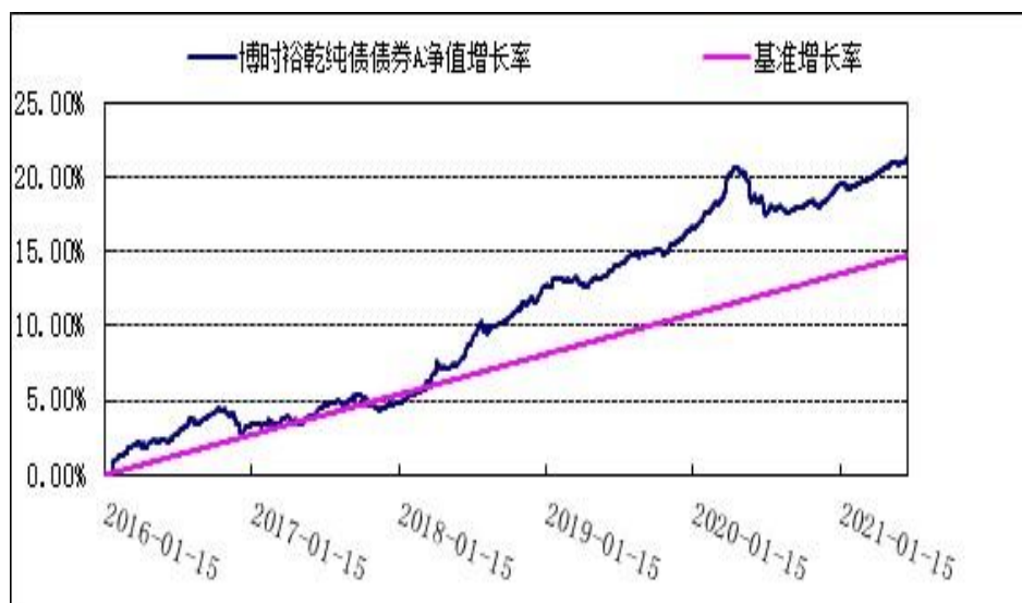
博时裕乾纯债债券 C