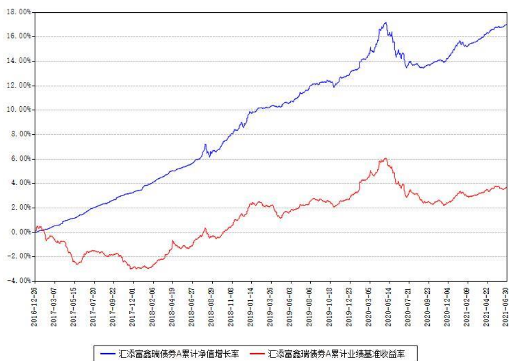
汇添富鑫瑞债券A累计净值增长率与同期业绩比较基准收益率对比图