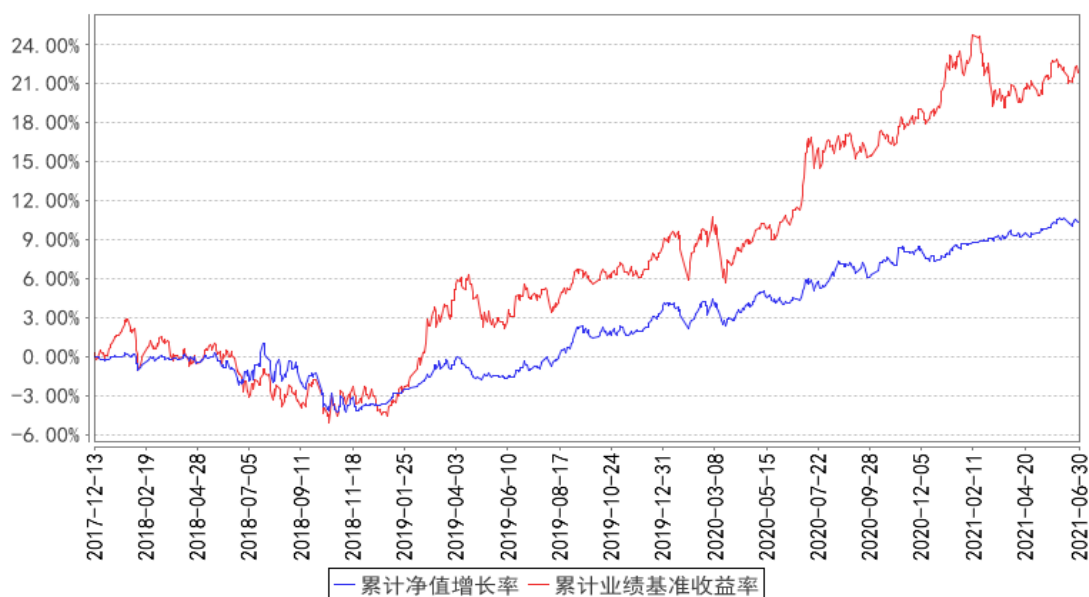
华富星玉衡混合A累计净值增长率与同期业绩比较基准收益率的历史走势对比图