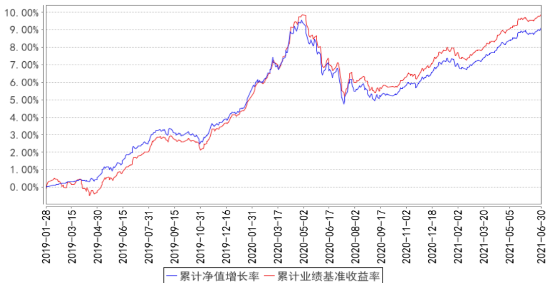
华富中证5年恒定久期国开债指数A累计净值增长率与同期业绩比较基准收益率的历史走势对比图